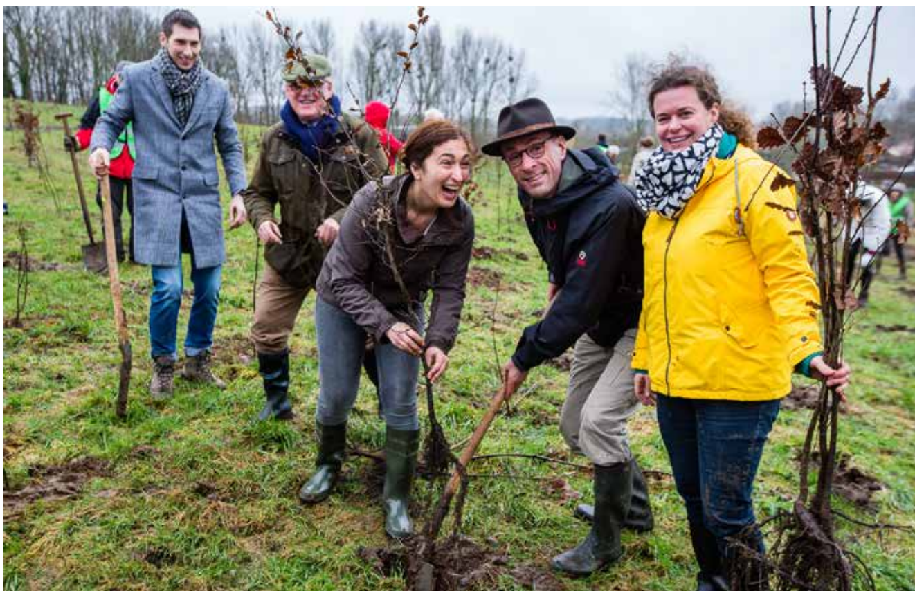
Minister Zuhal Demir