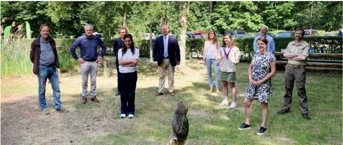
Minister Zuhal Demir