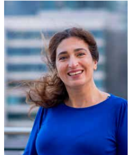
Minister Zuhal Demir

vergaderen, terwijl buitenlucht er net voor zorgt dat je meer inspiratie opdoet. Investeren in bossen is dus echt wel belangrijk voor de toekomst van heel veel mensen.