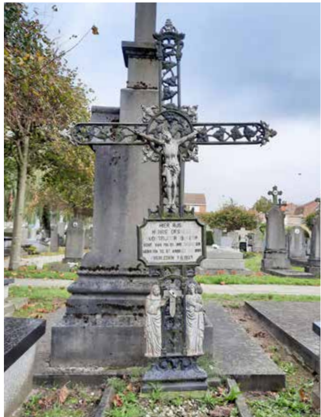
Gietijzeren kruisen werden meer dan 100 jaar lang vervaardigd.

Veel oude grafzerken zijn uit blauwe hardsteen gemaakt, een robuust en weerbestendig materiaal, maar hier en daar vindt men op oude begraafplaatsen ook nog de typische gietijzeren kruisen terug. De oorsprong van de meeste modellen ligt in de tweede helft van de 19 de eeuw en ze waren nog tot in de jaren 40 bij dezelfde producent te verkrijgen, nl. Nestor Martin, het merk dat in onze contreien vooral voor gietijzeren kachels bekend stond.