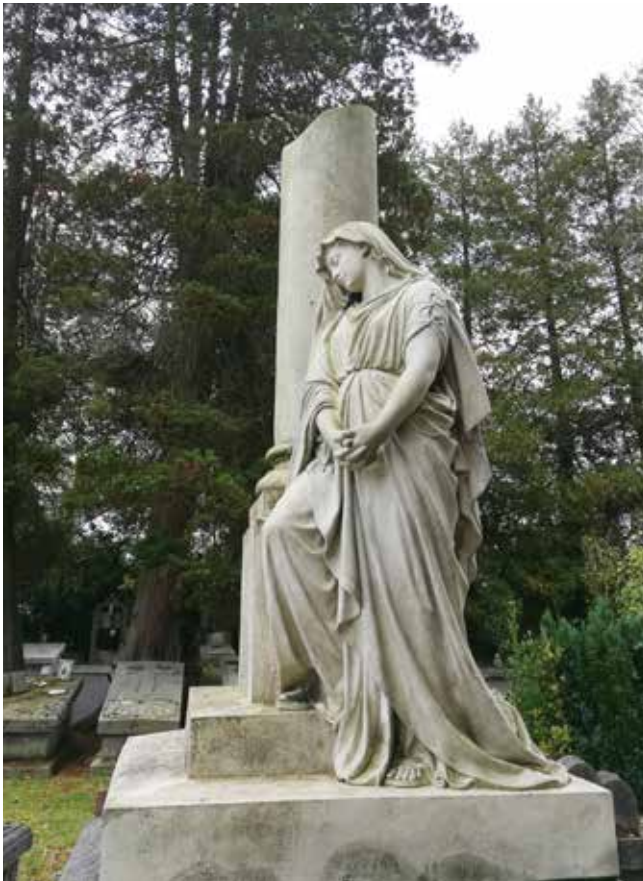
Afgebroken zuil: verwijst naar het jeugdige/te vroege of het plotse afbreken van het leven.