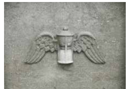
Zandloper: verwijst naar de vergankelijkheid van het leven en het naderen van het stervensuur. De gevleugelde zandloper is correct weergegeven als er zowel een vleermuis- als duivenvleugel aanwezig is. De eerste verwijst naar de nacht, de tweede naar de dag. Dit staat symbool voor de tijd tussen leven en dood. Vaak vinden we zandlopers terug met enkel vleermuisvleugels of enkel duivenvleugels.

Misschien minder te achterhalen, maar minsten zo boeiend, zijn de symbolen die uitgebeeld worden door menselijke figuren, dieren, planten, gebruiksvoorwerpen... Zo worden graven vaak versierd met bloemen. Zij staan symbool voor de ziel die zich opent voor God, net zoals een bloem zijn hart opent naar de zon. Klimop staat als groenblijvende plant symbool voor de onsterfelijkheid en het eeuwig leven. Dit verwijzen naar het eeuwige leven wordt trouwens niet enkel op graven zelf aangeduid, ook bepaalde beplanting op begraafplaatsen heeft een symbolische betekenis. Een taxusboom staat symbool voor onsterfelijkheid en het onvergankelijke. Dit heeft de boom te danken aan zijn blijvend groen uitzicht en zijn harde houtsoort. Onder de taxus werden in Engeland vaak rituele bijeenkomsten gehouden en de heilige boom werd als poort naar de spirituele wereld aanzien. Op kerkhoven plantte men taxusstekjes om overledenen te