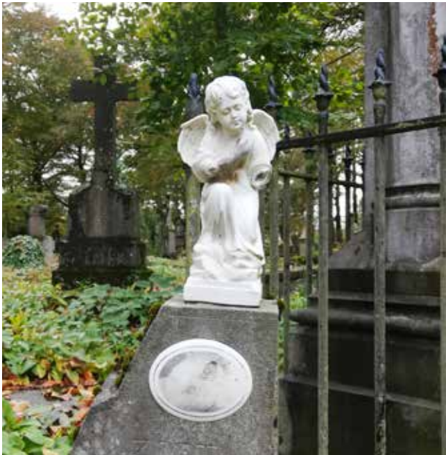
Engel: de engel is de begeleider van de ziel van de overledene naar het hiernamaals. Engeltjes komen frequent voor bij graven van kinderen en verwijzen naar de onschuld van het kind.