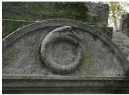
Ouroboros, de slang die zichzelf in de staart bijt: symbool van onsterfelijkheid en reïncarnatie.