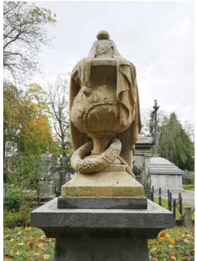
Asurne (vaak bovenop een pilaar): symbool voor dood en rouw, soms gesluisd, wat het afdekken van het leven symboliseert.

Binnen oude kerken vindt men soms nog grafzerken terug. Al in de middeleeuwen wou een gelovige zo dicht mogelijk bij het altaar of de relikwie van de heilige die in de kerk aanbeden werd begraven worden. De Kerk wilde dit enerzijds al vanaf de 6 de eeuw verbieden, maar haalde hier toch ook zijn voordeel uit: enkel de rijken en geestelijken hadden recht op dit privilege, de armere bevolking werd buiten de kerk begraven. Begraven worden in de kerk bracht echter problemen met zich mee: graven werden snel gemaakt, het liep soms mis met de stevigheid van de wanden en de grafstenen durfden al eens te verzakken. Door de kieren die hierbij ontstonden, kwam de lijkgeur soms de kerken binnen en al snel leidde dit tot de uitdrukking 'rijke stinkers'.