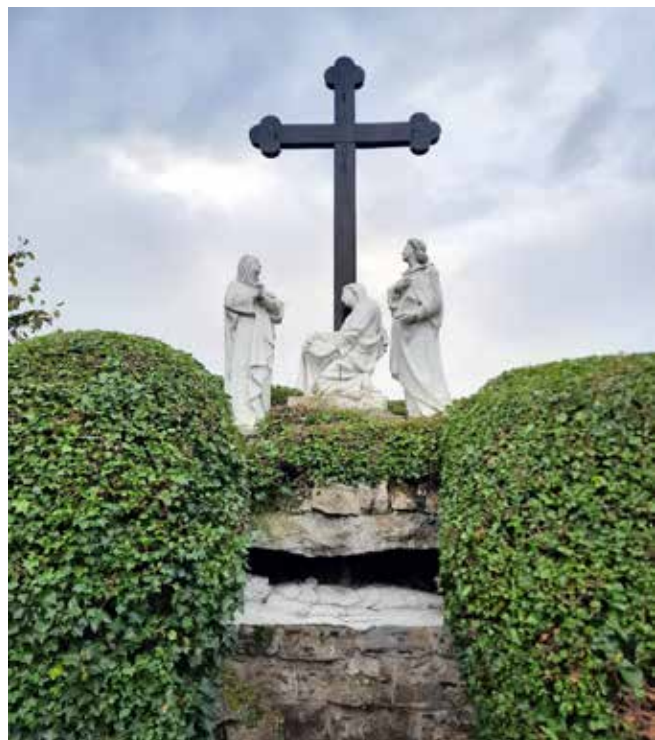
Een calvarie wordt op veel begraafplaatsen op het eindpunt van de toenmalige hoofdas ingeplant, zodat de blik van de bezoeker er naartoe getrokken wordt.

De meeste modellen zijn geïnspireerd op de neogotiek en er wordt volop gebruik gemaakt van christelijke en funeraire symboliek. Onder een lijdende Christusfiguur aan het kruis zien we vaak engelen of Maria en Johannes de evangelist. De calvarie is trouwens als beeldengroep ook heel vaak op begraafplaatsen terug te vinden.