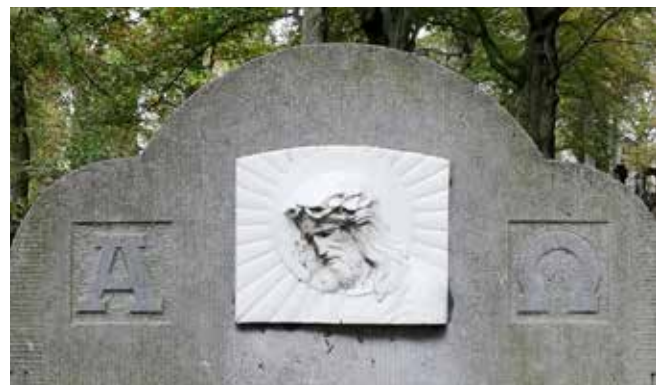
De Griekse letters Alfa en Omega als symbool voor God als begin en einde van de kosmos.

Er wordt niet alleen teruggegrepen naar het Latijn. De letters Alfa en Omega staan als eerste en laatste letter van het Griekse alfabet symbool voor God als begin en einde van de kosmos. De grondslag voor deze symboliek is terug te vinden in de bijbeltekst "Ik ben de Eerste en Ik ben de Laatste; buiten Mij is er geen God." (Jesaja 44:6). De beide letters werden veel gebruikt om aan te duiden dat de overledene in God zijn begin- en einddoel zag.