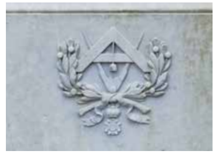
Passer en winkelhaak: veelal symbolen van vrijmetselarij, maar ook van een architect. De passer verwijst naar het spirituele, de winkelhaak naar het materiële. De naar elkaar geopende winkelhaak en passer leggen een brug tussen het onuitsprekelijke (spirituele) en het bekende (materiële).