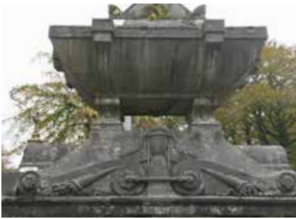
Omgekeerde fakkel: symbool van het uitdovend licht, het uitdovend leven.