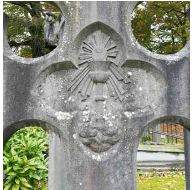
Kelk (met hostie): symbool voor de eucharistie, komt bijna uitsluitend voor op priestergraven.

De kruisen op de begraafplaats zijn niet de enige graftekens van het neogotische type. De neogotische (bouw)stijl is een typische stijl van de 19 de eeuw die vanuit een romantische belangstelling voor de middeleeuwen teruggrijpt naar de gotische bouwkunst van weleer. Daar waar neogotiek zeer populair was bij katholieken, valt de neoclassicistische stijl veel meer in de smaak bij liberalen. Dit valt eveneens op in de stijl van de grafzerken.