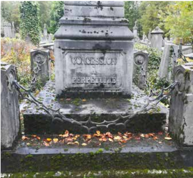
De eeuwige vergunning drukt de wens uit dat de overledene voor altijd wordt herdacht en herinnerd.

De eeuwige vergunning werd in 1971 afgeschaft. We kunnen het als een zegen beschouwen dat de eeuwige vergunning bestond, anders waren heel wat oude graven verdwenen, maar door de afschaffing ervan zijn in de periode na 1971 heel wat oude en waardevolle graven verdwenen. In gemeenten waar geen middelen voorradig waren om graven te verwijderen, of er geen noodzaak voor het vrijmaken van ruimte bestond of waar eeuwige vergunningen vervangen werden door 50-jarige concessies, werden graven ongemoeid gelaten. Een voordeel, want het zijn net die graven die een belangrijk onderdeel van ons funerair erfgoed vormen.