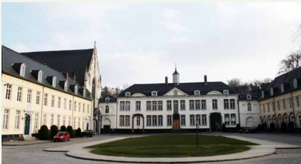
Ter Kameren Abdij, , 13e-18e eeuw, Brussel

Sinds 1977 werden er ook subsidie-systemen gecreëerd om deze leemte te vullen. Het is welbekend dat onderhoud en restauratie van een geklasseerd goed uitdrukkelijk duurder zijn, met name door de kwaliteitseisen van de regionale administraties van monumenten en landschappen en de koninklijke commissies voor monumenten en landschappen, maar ook door de zware administratieve lasten ten gevolge van de complexe en langzame procedures die geklasseerd erfgoed vereisen. De hulp van de overheden aan de privé-eigenaren