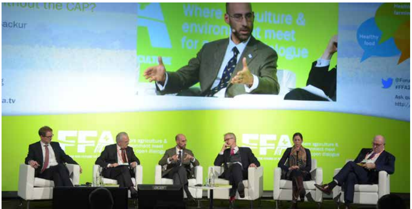
Session 3 discussion on the future for EU farming

geven: een daling in extreme armoede, een daling van de kindersterfte, een toename van de gelletterheid en een groeiend aantal vrouwen die de kans krijgen een active rol te spelen in de arbeidsmarkt. De koningin legde de nadruk op het enorme belang van landbouw en milieubescherming bij het realiseren van een betere wereld inclusief de duurzame economie, menselijk welzijn, vrede en veiligheid. Koningin Noor had een specifieke boodschap voor de private sector. Ze vroeg om de nodige stappen te nemen opdat landbouwers over de gehele wereld toegang zouden krijgen tot gewassen met een hoge opbrengst, betere distributiesystemen en een betere toegang tot kennis en onderwijs.