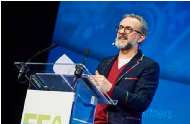
Massimo Bottura, Food for Soul