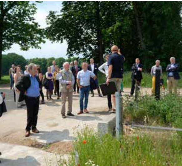
Uitleg door de gids