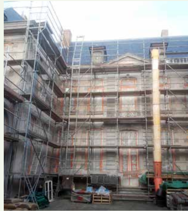
Hôtel de la Roche, 1750, Mons © Léon Lock

van geklasseerd erfgoed (in de vorm van subsidies en fiscale aftrekbaarheid) is in grote mate bedoeld als compensatie van de verplichting geklasseerd erfgoed volgens normen, die de prijs opdrijven, te onderhouden en te restaureren, alsook van de kosten gekoppeld aan het toegankelijk maken voor het publiek.