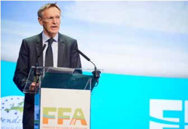
Janez Potocnik, FFA-voorzitter