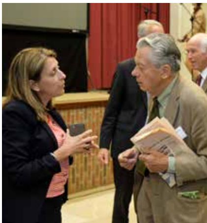
Herita in gesprek