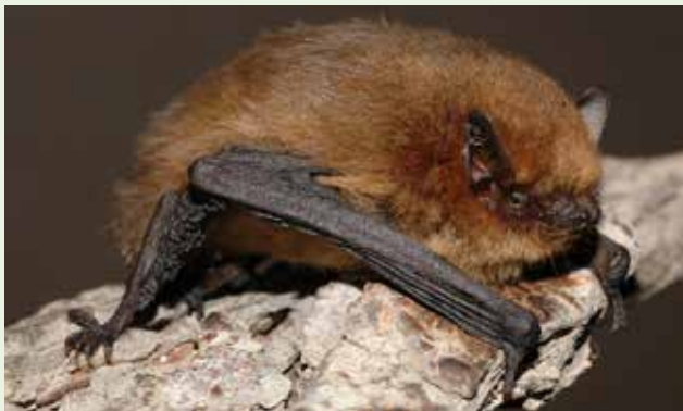
© Kleine dwergvleermuis, © Evgeniy Yakhontov - wikimedia.org

Beheer: behoud van zones met ondiep, permanent water en overgangszones naar een gevarieerde vegetatie bestaande uit grassen.