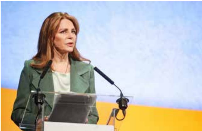
Koningin Noor Al Hussein van Jordanië