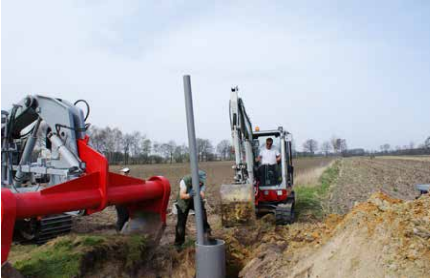
Aanleg van een peilput

tenslotte naar een speciaal voorziene verzamelput (ook wel 'regelput' of 'niveauput' genoemd), waar de eigenlijke peilregeling plaatsvindt. Dit gebeurt met behulp van een regelbuis, veelal niet meer dan een doodgewone PVC-buis die op de gewenste peilhoogte (meestal 30 – 40 cm onder het maaiveld) voorzien is van een doorlaatopening. Zolang de regelbuis gemonteerd is, zal het waterpeil tot op dit gewenste niveau blijven. Wanneer de percelen echter toegankelijk dienen te zijn voor bewerking kan de landbouwer door het eenvoudig verwijderen van de regelbuis het peil doen zakken tot op het oorspronkelijke drainageniveau. Of nog: enkel op het moment dat de landbouwer met zijn machines op het veld moet zijn, wordt er gedraineerd tot op het klassieke niveau. Buiten de zaai- en oogstperiode blijft het water echter een pak hoger staan.