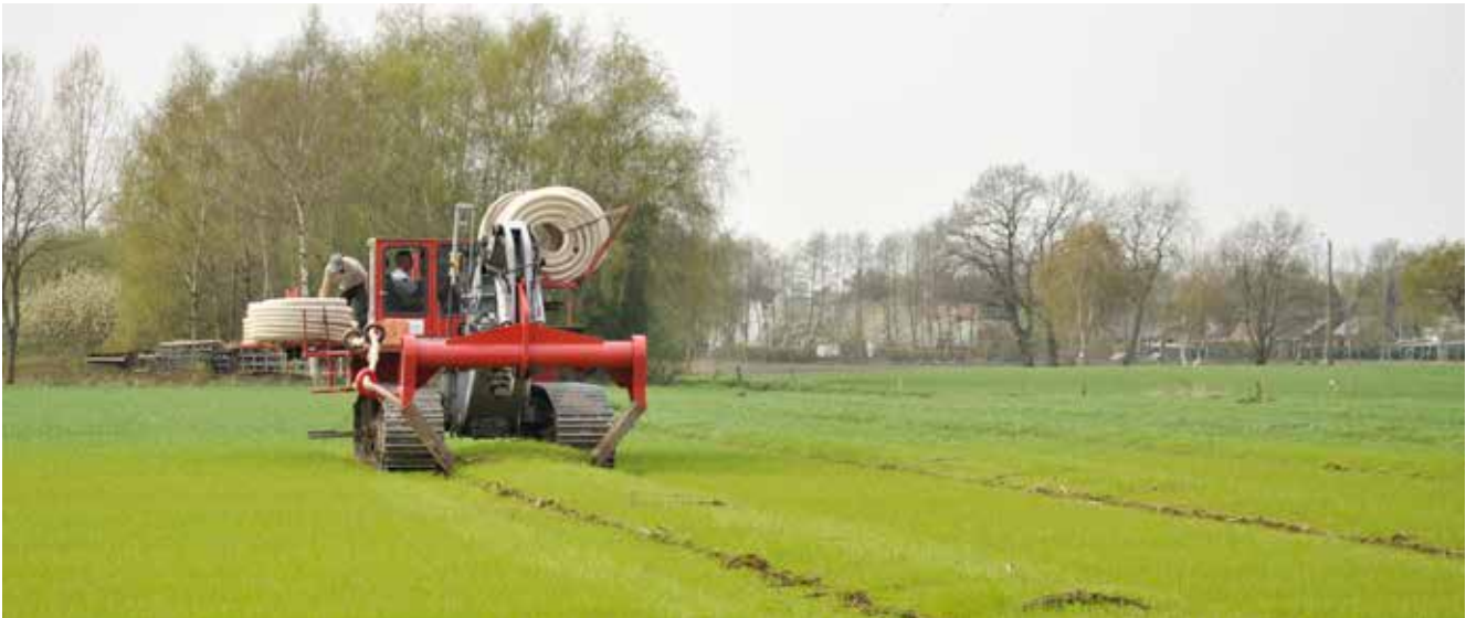
Aanleg van de ondergrondse afvoerbuizen

dergelijke gronden in de regel sowieso al minder landbouw zal worden aangetroffen. Rest dan nog de kostprijs. Peilgestuurde drainage is wel degelijk duurder dan klassieke drainage. Eigenaars moeten rekenen op een meerkost van zo'n 600-900 €/ha, al is dit steeds afhankelijk van de concrete situatie op het terrein. Bovendien is het onderhoud ook complexer dan bij een conventioneel systeem. Hoewel onderhoud minder frequent nodig zal zijn (doordat de buizen minder worden blootgesteld aan oxidatie), zal onderhoud – eens het nodig blijkt – doorgaans meer tijdrovend zijn. De afvoerbuizen kunnen immers niet zomaar vanuit een opening in de slootrand worden proper gespoten maar zijn enkel via de verzamelbuis bereikbaar. Hiervoor is toch wel enige expertise vereist. Toch dient de meerkost steeds te worden bekeken ten opzichte van de meeropbrengst. Door de grondwaterpeilverhoging wordt al snel zo'n 30% meer water vastgehouden. Studies van de bodemkundige dienst wijzen uit dat dit wordt vertaald in een jaarlijkse meeropbrengst ter waarde van 100 €/ha voor maïs, 150 €/ha voor gras en zelfs 360 €/ha voor aardappelen. Een grondig aangelegd peilgestuurd drainagesysteem gaat al gauw 20-30 jaar mee. Over die periode bekeken verdient het systeem zichzelf dus meer dan terug. Bottom line is dat peilgestuurde drainage zonder twijfel heel wat voordelen met zich