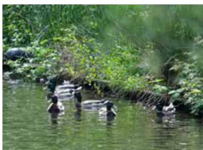
Het prachtige domein rond de abdij.

het slotklooster. Zo kwamen we te weten dat de paters 45.000 flesjes bier per dag produceren. Naast de brouwerij, beschikken de paters ook over een eigen boerderij. De melk wordt gebruikt voor hun kaasproducten, die slechts in speciaalzaken te koop zijn. Tot slot bakken de paters ook hun eigen brood. De gasten waren waarlijk onder de indruk van de moderne infrastructuur. De winst die gemaakt wordt op hun producten gaat naar goede doelen.