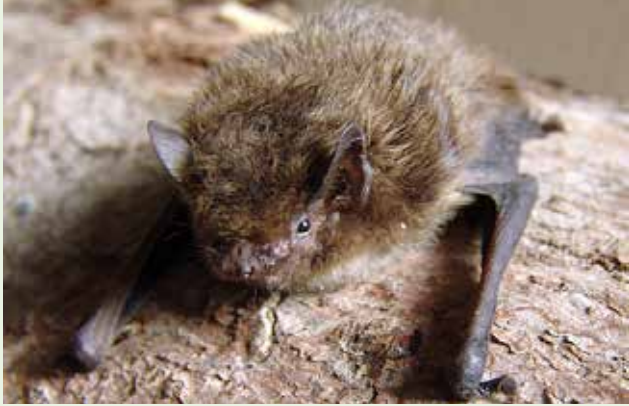
© Ruige dwergvleermuis, © Mnolf - wikimedia.org